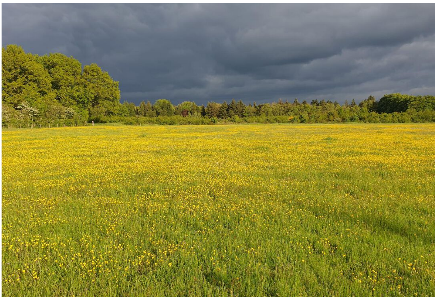
Zandspoor 2 "perceel 2" 0 ong, Doorn